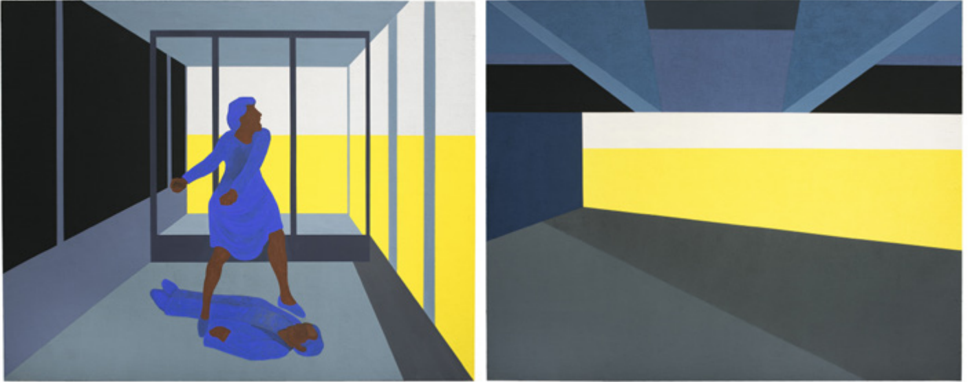
Sin título | Untitled . Serie | Series Pintura inhumana, 2024 Acrílico sobre MDF y silicio | Acrylic on MDF and silicon 183 x 230 cm c/u | 72 x 90.6 in each Inventario | Inventory: LT333, LT334