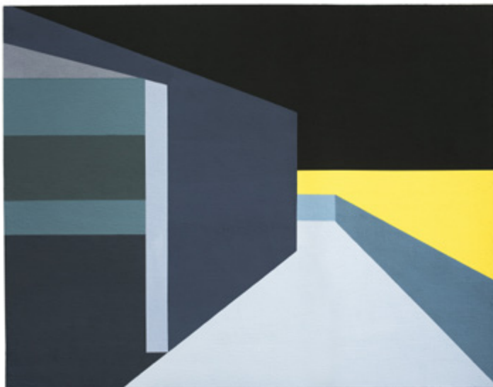
Sin título | Untitled . Serie | Series Pintura inhumana, 2024 Acrílico sobre MDF y silicio | Acrylic on MDF and silicon 183 x 230 cm c/u | 72 x 90.6 in each Inventario | Inventory: LT335, LT336