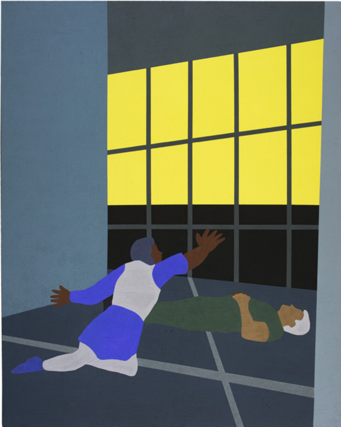
Sin título | Untitled . Serie | Series Pintura inhumana, 2024 Acrílico sobre MDF y silicio | Acrylic on MDF and silicon 230 x 183 cm | 90.6 x 72 in Inventario | Inventory: LT339