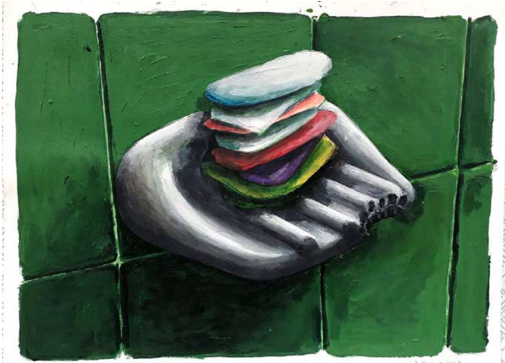
El amor , 2020 | Inventario: DF089