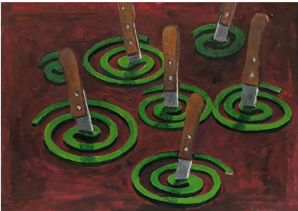
El cazador cazado , 2020 | Inventario: DF090