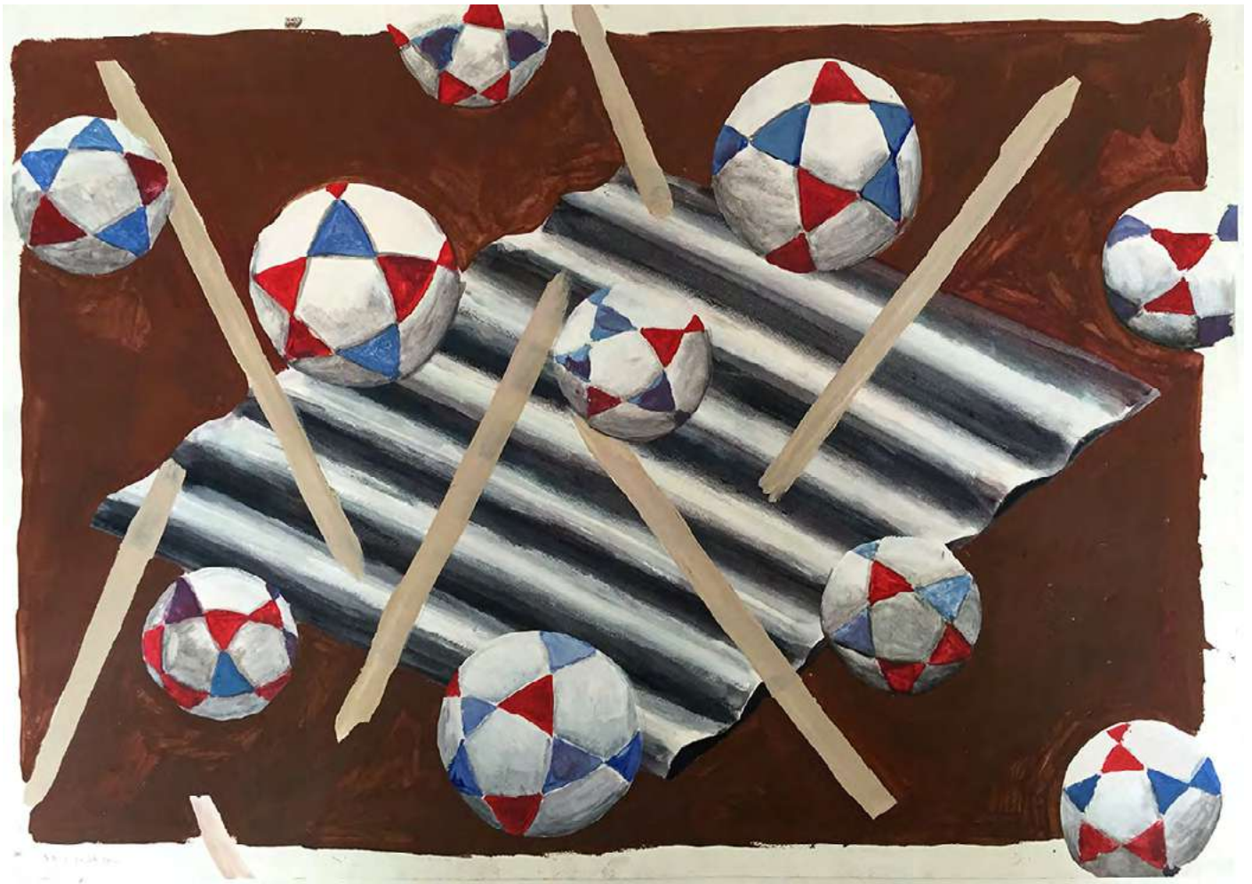
Sin título , 2016 Acrílico sobre papel 30 x 40 cm Inventario: DF047