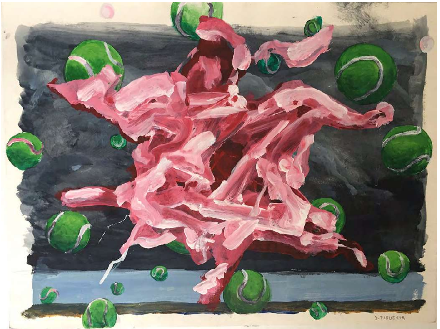
Sin título , 2016 Acrílico sobre papel 30 x 40 cm Inventario: DF045