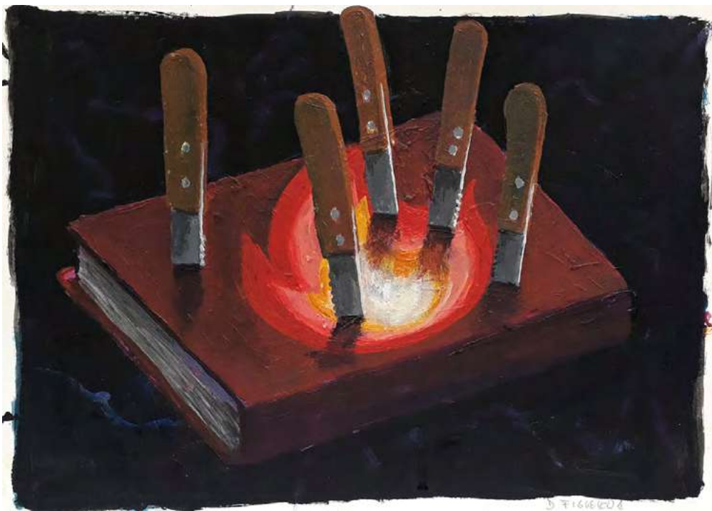
El secreto del fuego , 2020 | Inventario: DF091