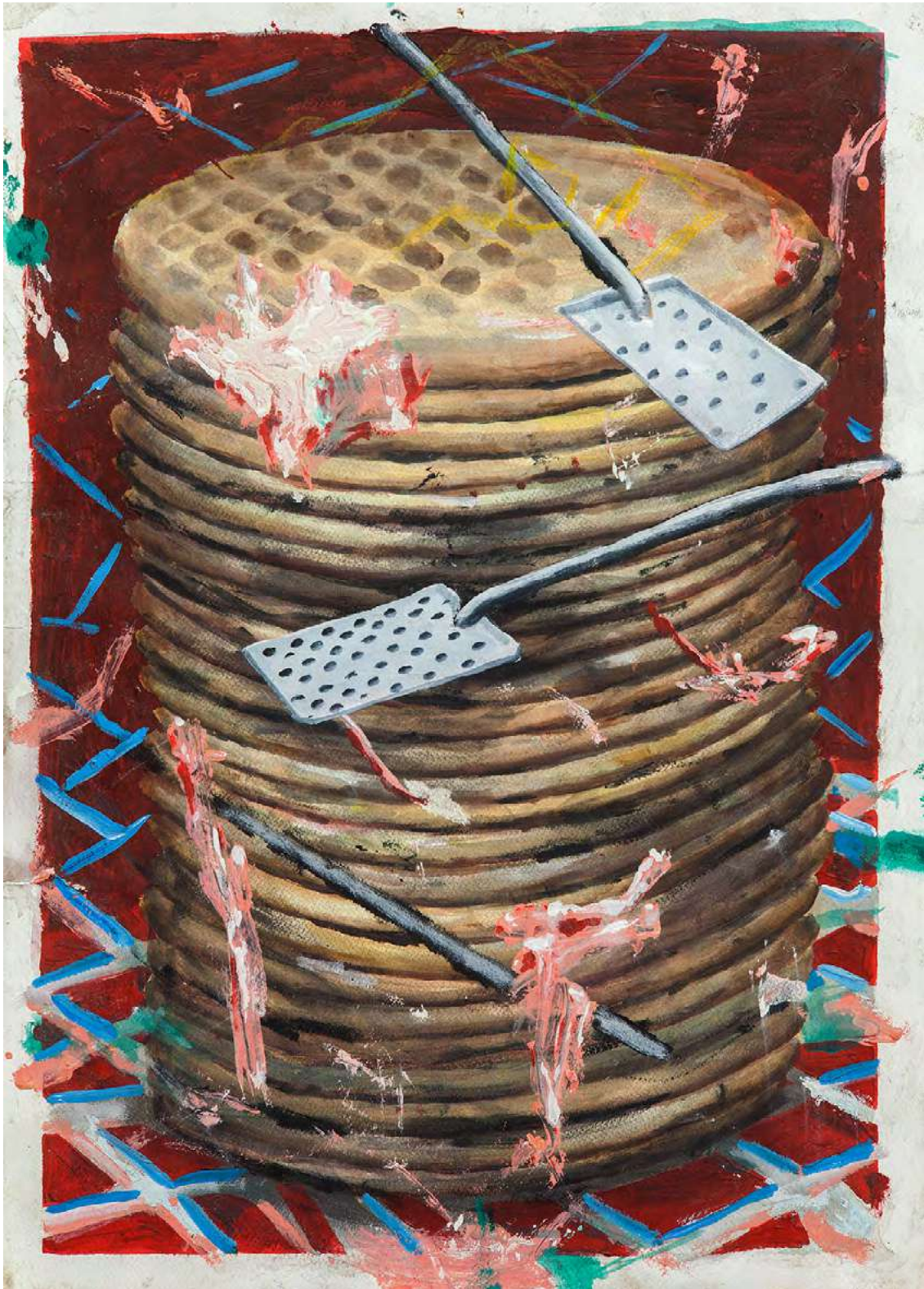
Base , 2018 Acrílico sobre papel 70 x 50 cm Inventario: DF115