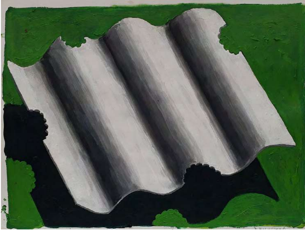
Familia , 2020 | Inventario: DF092