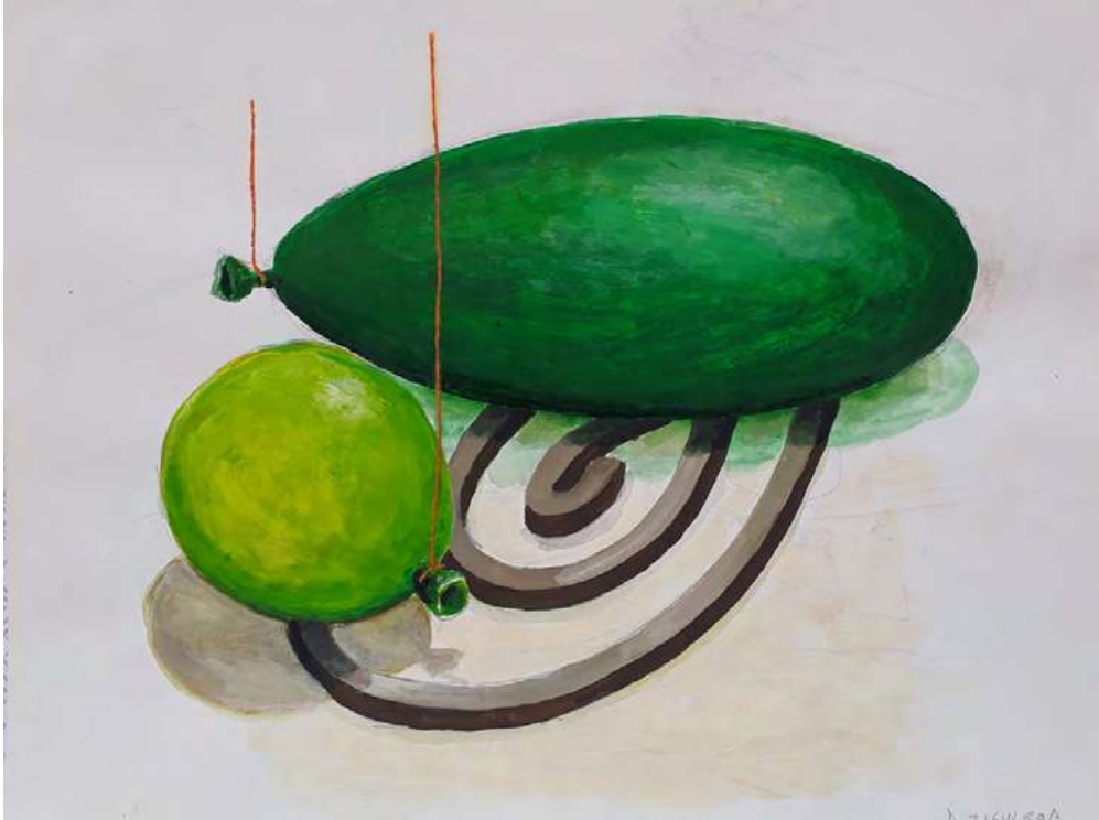
Magia y plomo , 2020 | Inventario: DF095