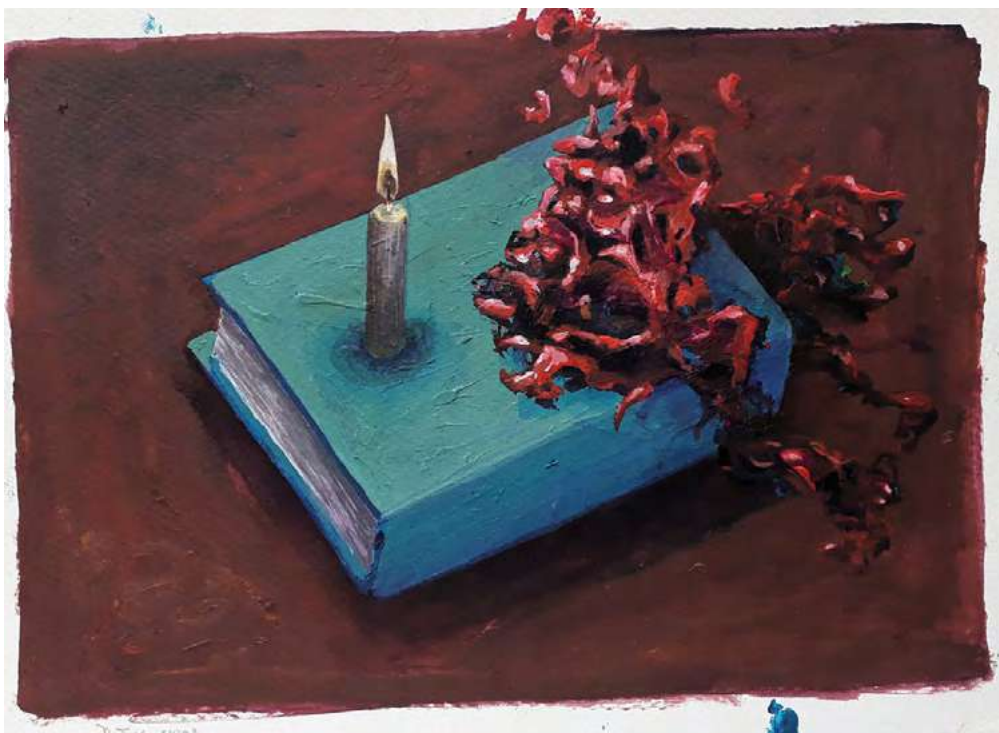
Imborrable , 2020 | Inventario: DF093