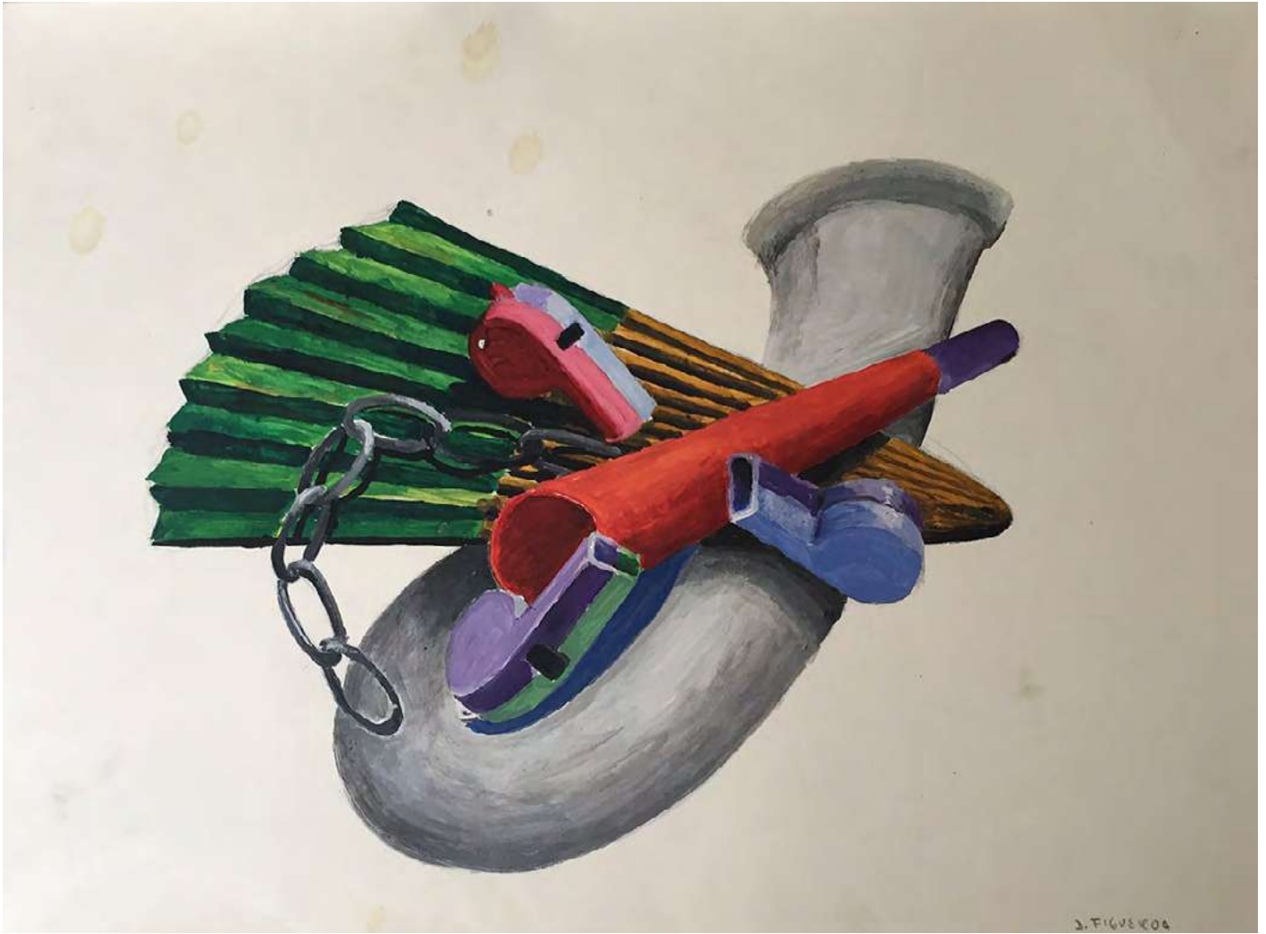
Sin título , 2016 Acrílico sobre papel 30 x 40 cm Inventario: DF043