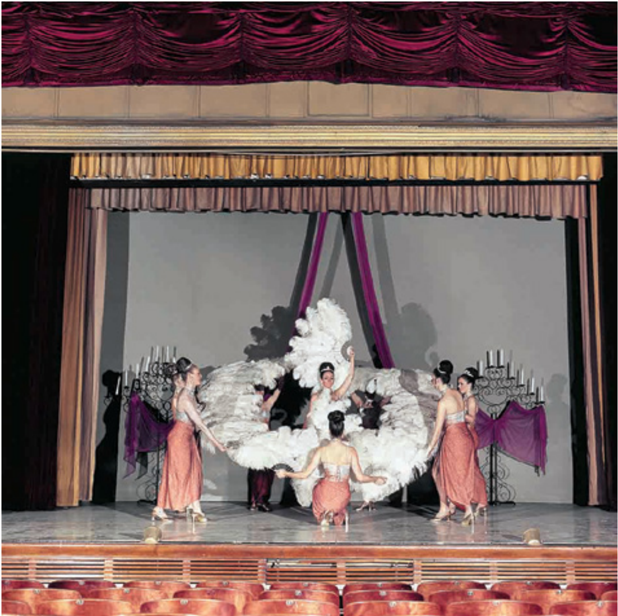
The Royal Bluebell girls, Gran despiplume en el maipo. Teatro Maipo, 1972

Impresión giclée; impreso en 2021 | Giclée print; printed 2021