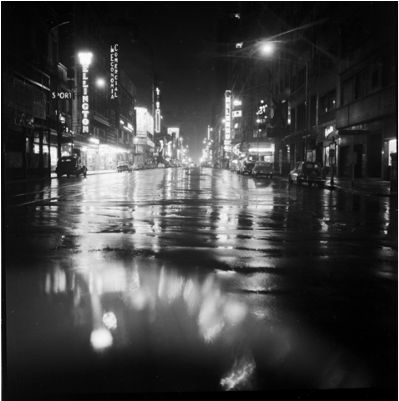
Corrientes y Uruguay, 1965

Gelatina de plata; impreso en 2021 | Gelatin silver print; printed 2021 37 x 37 cm | 14.6 x 14.6 in Edición de 5 | Edition of 5 Inventario | Inventory: FEL0621, FEL0622 , FEL0623, FEL0624, FEL0625 USD 1.500