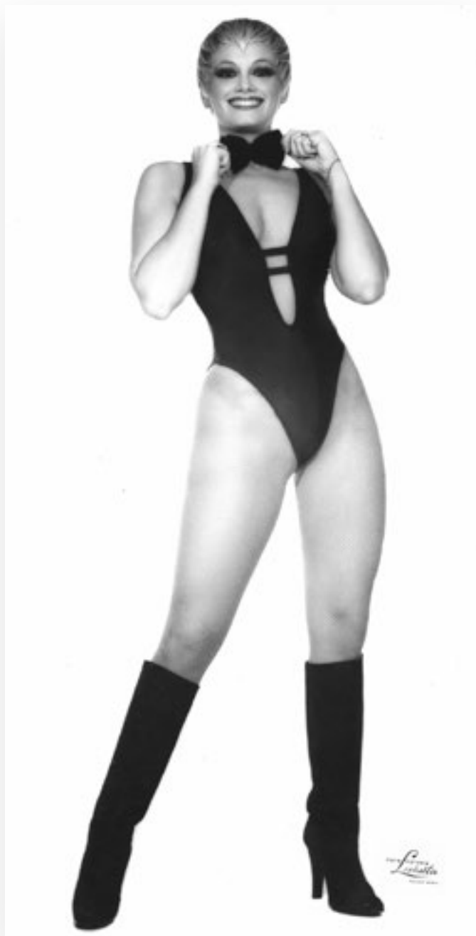
Carmen Barbieri, 1974