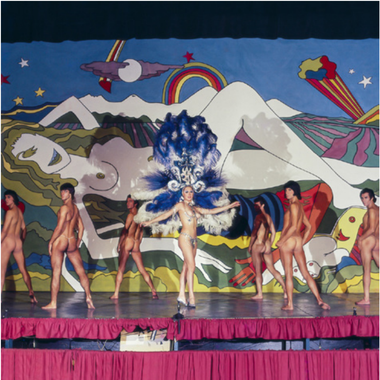
Cena Para Amante , 1972

Impresión giclée | Giclée print 100 x 100 cm | 39.4 x 39.4 in Edición de 5 | Edition of 5 Inventario | Inventory: FEL0016, FEL0017, FEL0018, FEL0019, FEL0020 USD 2.500