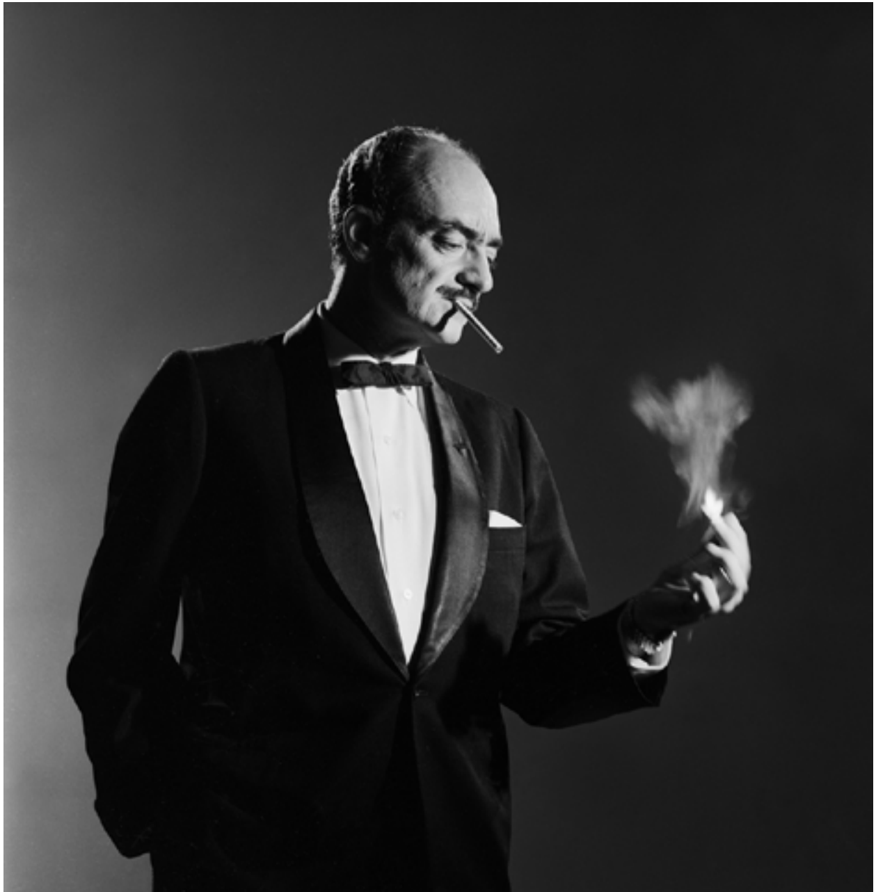
René Lavand, 1972

Gelatina de plata | Gelatin silver print 37 x 37 cm | 14.6 x 14.6 in Edición de 5 | Edition of 5 Inventario | Inventory: FEL0208, FEL0209, FEL0210, FEL0211, FEL0212 USD 1.500