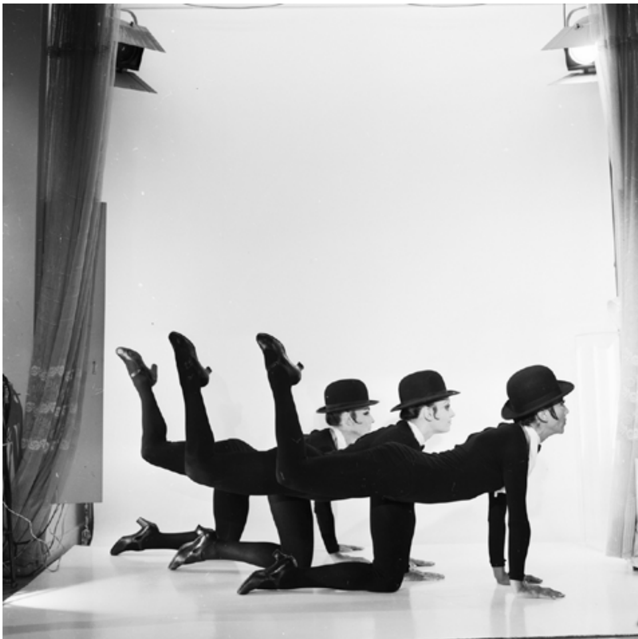
Las gromas, 1973

Gelatina de plata; impreso en 2019, 2021 | Gelatin silver print; printed 2019, 2021