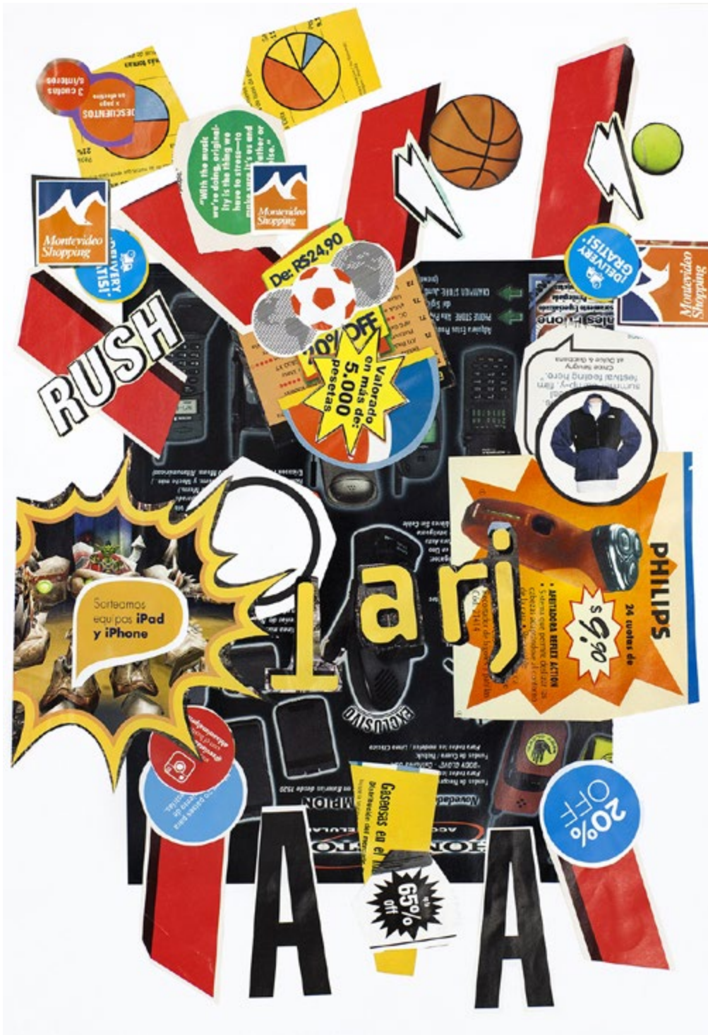
41. Serie | Series Poemas para duendes en vertical, 2018