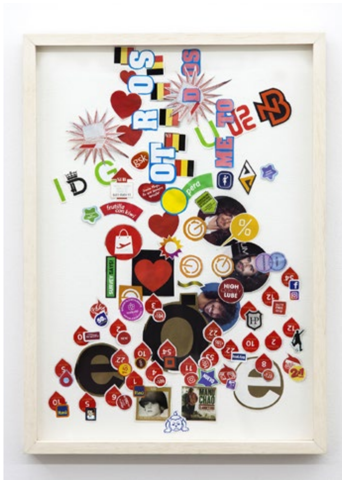
04. Inventario | Inventory: DU030