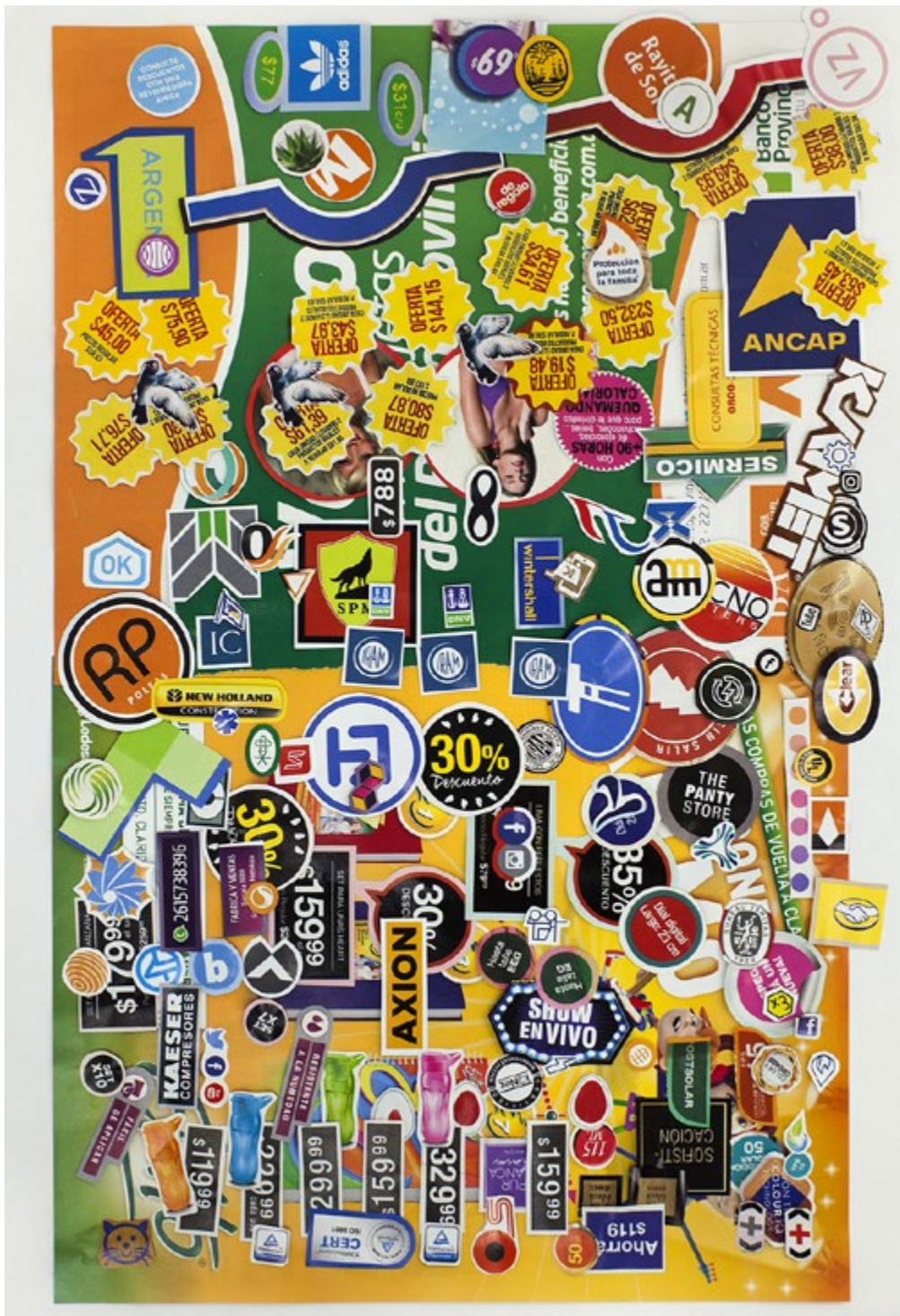
14. Serie | Series Duendadas, 2019 Collage sobre papel | Collage on paper 46 x 32 cm | 18.1 x 12.6 in Inventario | Inventory: DU100