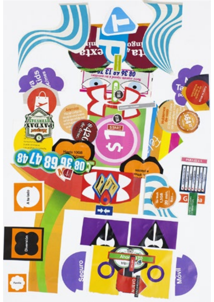
36. Inventario | Inventory: DU077

Serie | Series Primeros poemas para duendes en vertical, 2018 | Collage sobre papel | Collage on paper 46 x 32 cm c/u | 18.1 x 12.6 in each