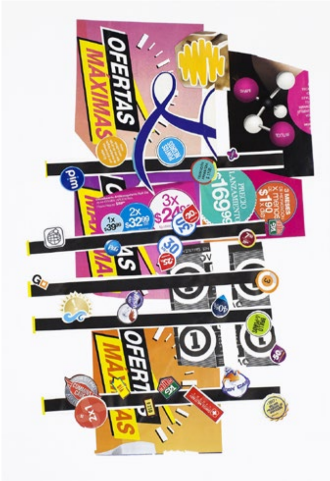
34. Inventario | Inventory: DU076