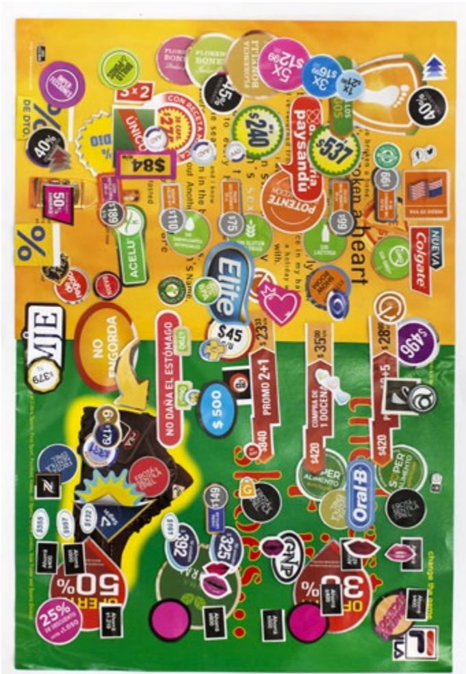
15. Serie | Series Duendadas, 2019 Collage sobre papel | Collage on paper 46 x 32 cm | 18.1 x 12.6 in Inventario | Inventory: DU98

Exhibida en | Exhibited in: ORDEN Y SECRETO , curaduría de Nicolás Cuello, Hache galería, Buenos Aires, Argentina, 2019