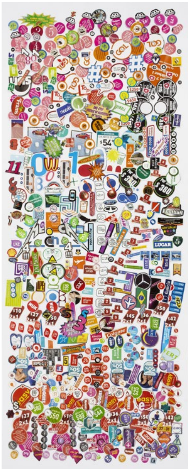
03. Inventario | Inventory: DU089