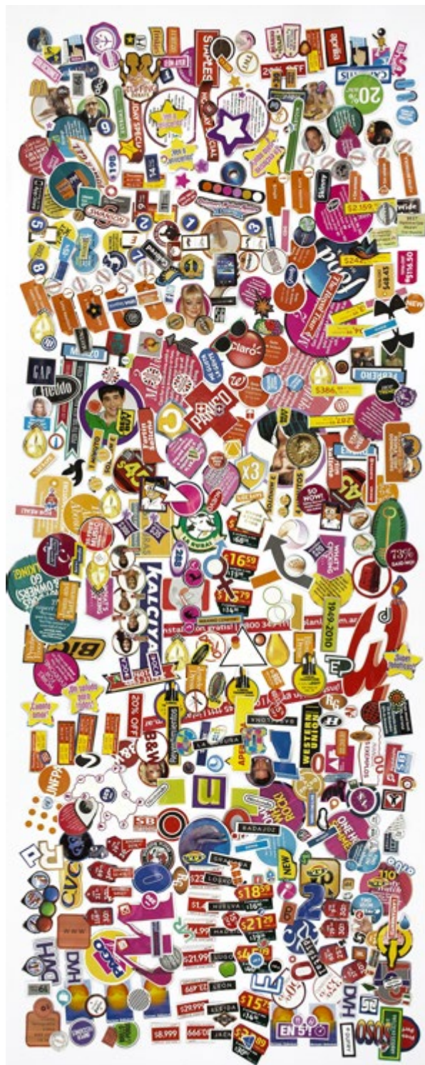
04. Inventario | Inventory: DU090

Serie | Series Grandes poemas para duendes en vertical, 2018 | Collage sobre papel | Collage on paper 102 x 40,5 cm c/u | 40.1 x 15.9 in each