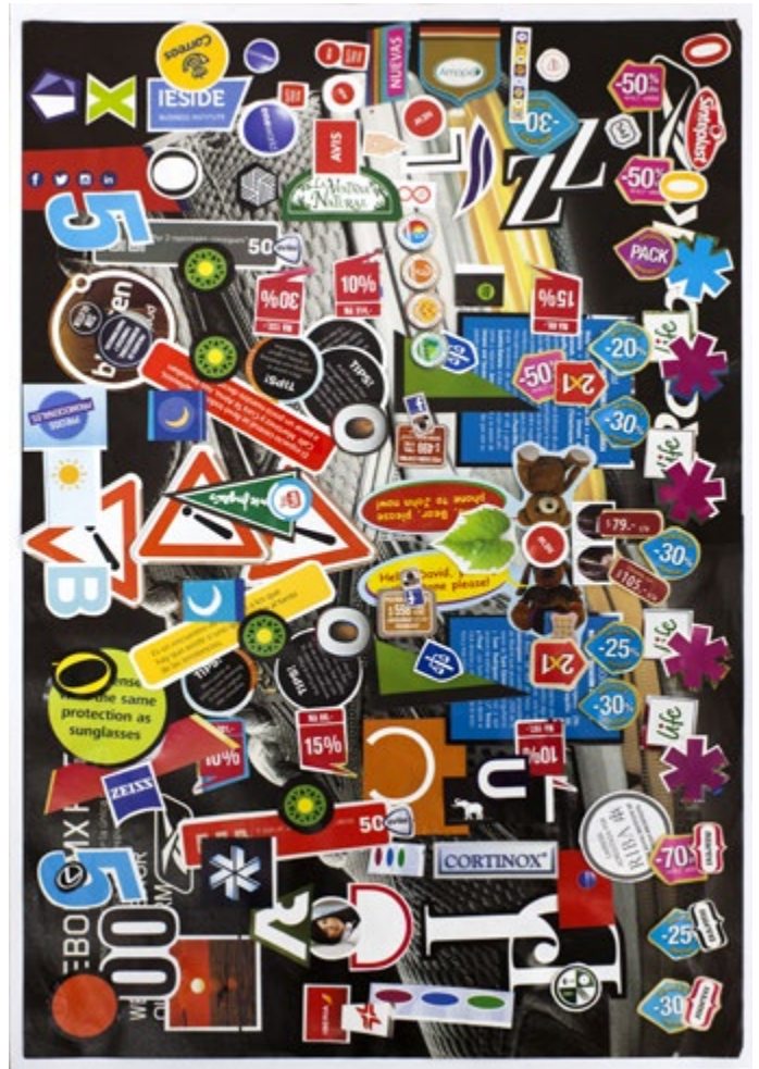
10. Serie | Series Duendadas, 2019 Collage sobre papel | Collage on paper 46 x 32 cm | 18.1 x 12.6 in Inventario | Inventory: DU99