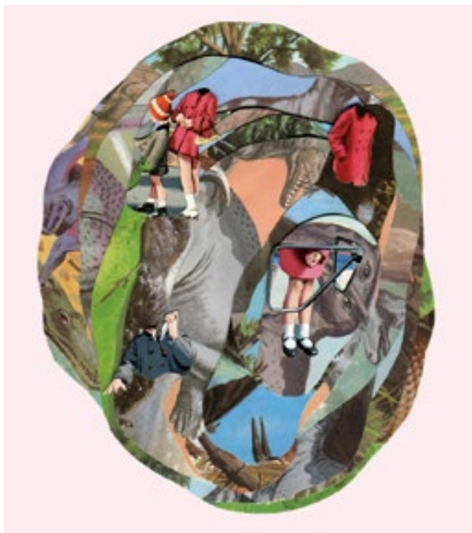
Sin título | Untitled. Serie | Series Mammoth, 2012 Collage | Collage 31 x 32 cm | 12.2 x 12.6 in Inventario | Inventory: CS415