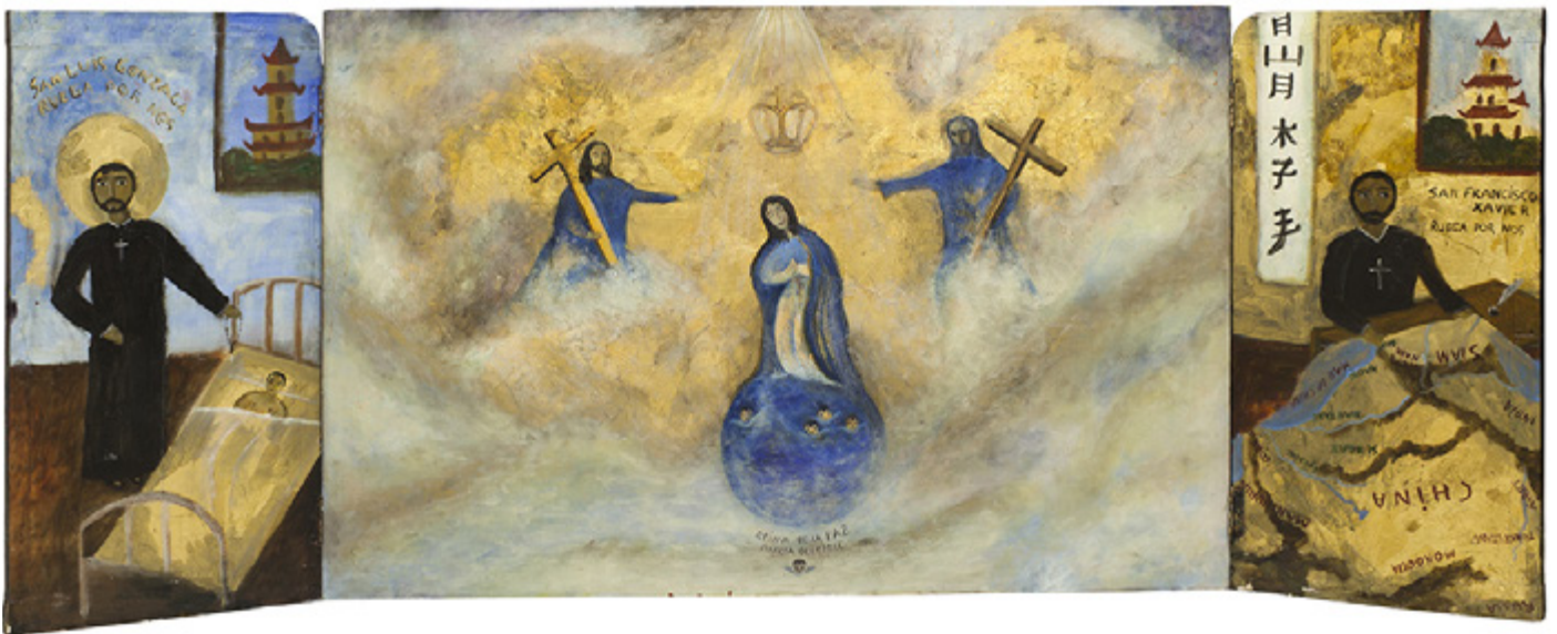
La Coronación de la Virgen María, 1997

Óleo sobre laca china sobre madera | Oil on Chinese lacquer on hardboard