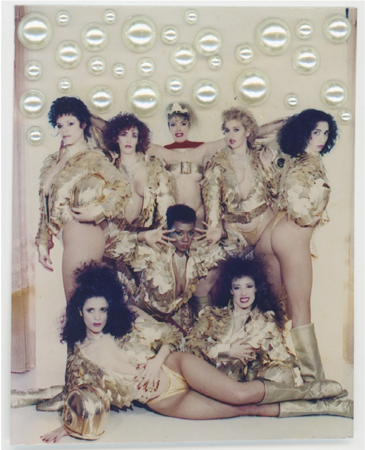
Las Gatas de Porcel, ca. 1990

C-print y composición de strass; impreso en 2023 | C-print and strass composition; printed 2023 9,5 x 7 cm | 3,7 x 2,8 in Edición de 25 | Edition of 25 Inventario | Inventory: FEL1343