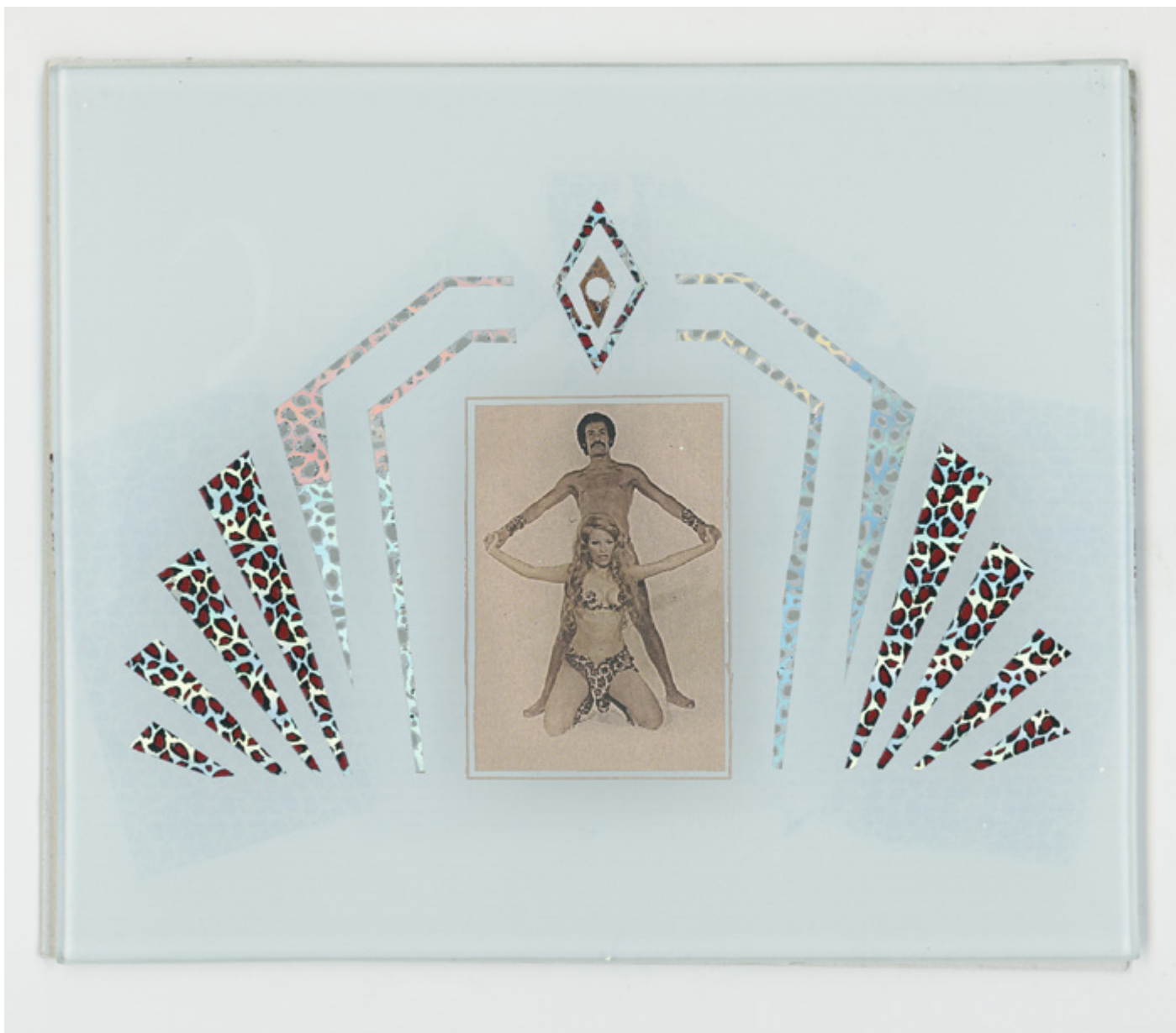
Pochi Luna y Susana Pazos, 1975

Impresion bajo vidrio, c-print y foil; impreso en 2023 | Under Glass print, C-print and Foil accents; printed 2023