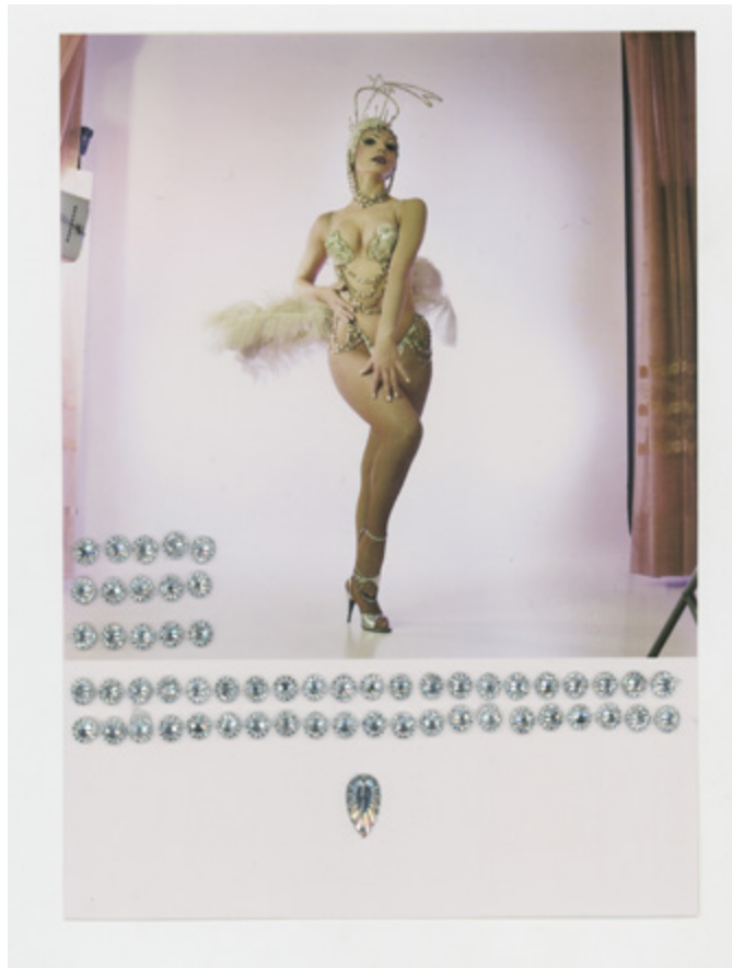
Tita Merello, ca. 1980

C-print y composición de strass; impreso en 2023 C-print and strass composition; printed 2023 15 x 15 y 21 x 15 cm c/u | 5.9 x 5.9 & 8.3 x 5.9 in each Edición de 25 | Edition of 25 Inventario | Inventory: FEL1017 , FEL1018