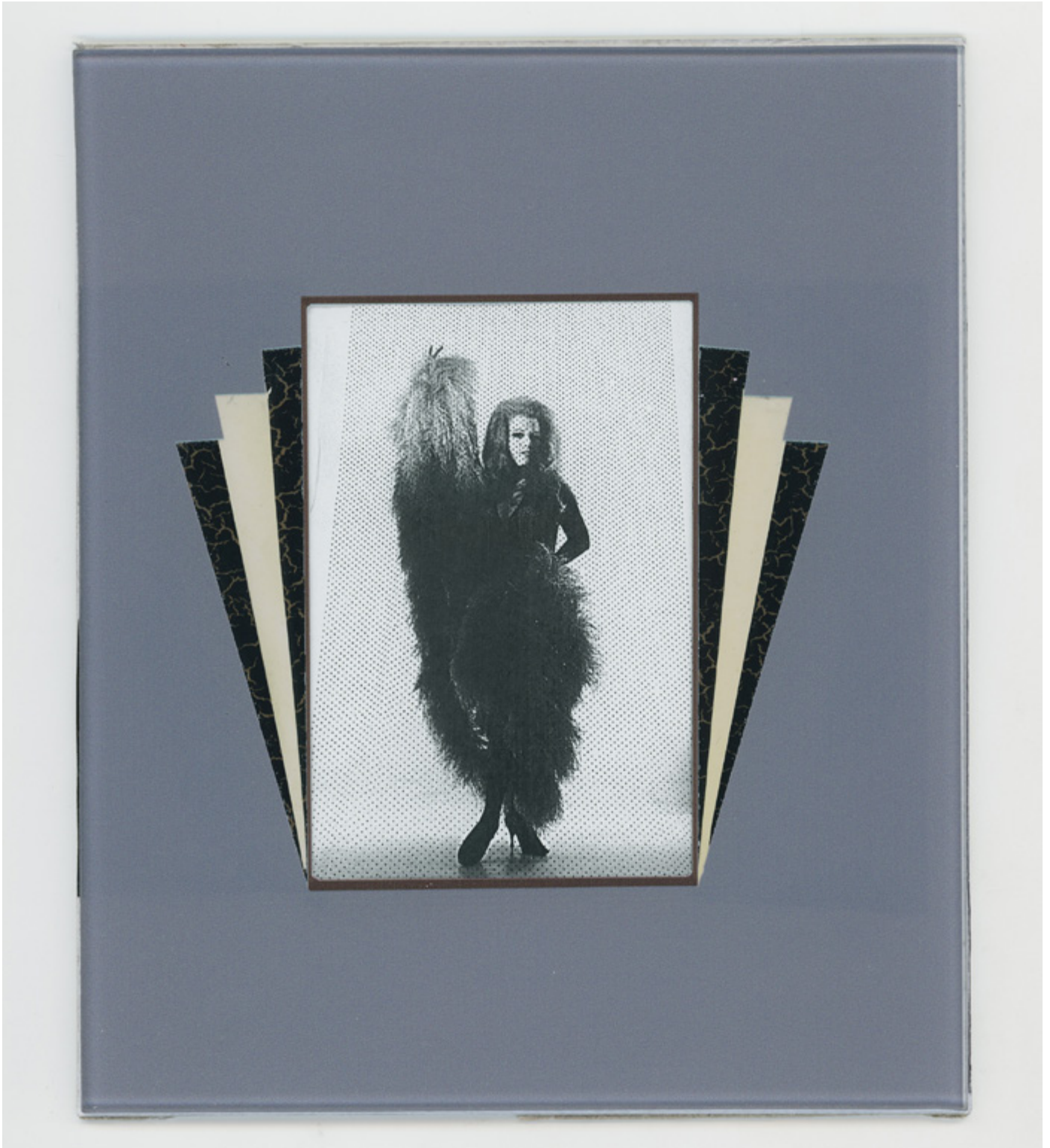
Nélida Roca, 1970

Impresión bajo vidrio, c-print y foil; impreso en 2023 | Under Glass print, C-print and Foil accents; printed 2023