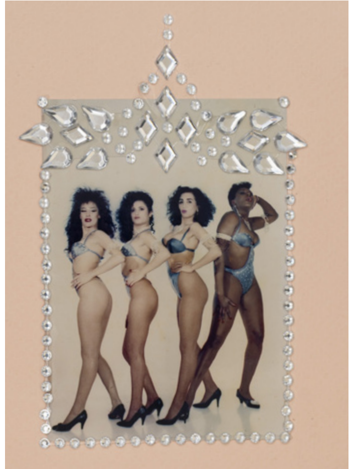
Las Gatas de Porcel, ca. 1990

C-print y composición de strass; impreso en 2023 | C-print and strass composition; printed 2023