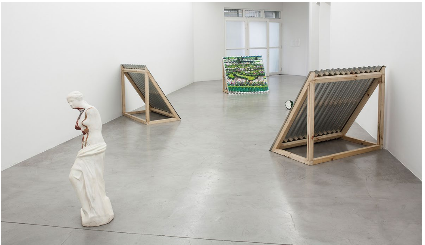
Vistas exhibición Mi reina , curaduría Francisco Ali-Brouchoud, HACHE

Exhibition view Mi reina , curated by Francisco Ali-Brouchoud, HACHE, Buenos Aires, Argentina, 2018 - 2019