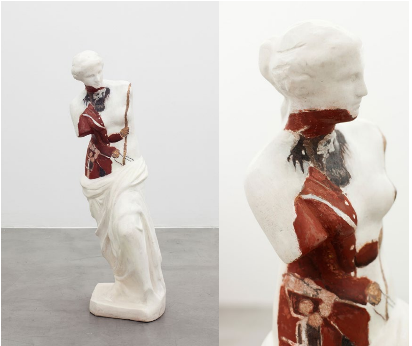
Los infernales de Venus, 2018 | Los infernales de Venus, 2018 Pintura sintética y tatuaje de cemento y ferrite sobre estatua de jardín Synthetic Enamel paint, cement tattoo, and ferrite on a garden statue 35 x 90 x 30 cm | 13.8 x 35.4 x 11.8 in Inventario | Inventory: DF84