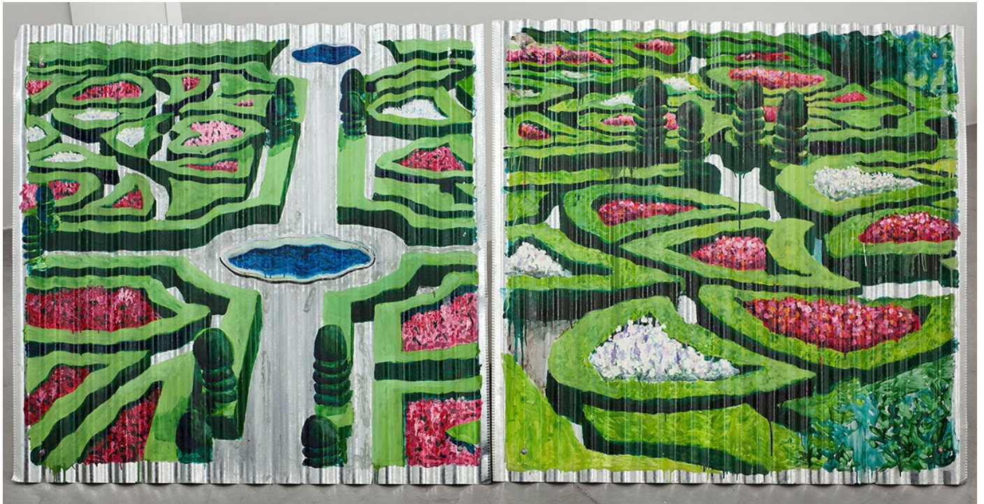
Los jardines de Mi reina 5, 2018